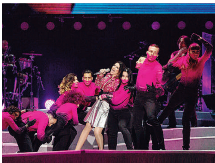
Due momenti del trionfale primo dei due concerti di Laura Pausini allo Stadio di San Siro di Milano, dove ha aperto il suo "Simili Tour", tra successi e coreografie